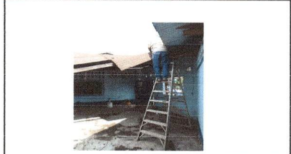
Foto 8: Trabajando en el cambio de estructura de madera por estructura metálica.